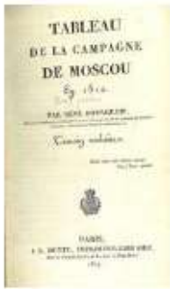
TABLEAU DE LA CAMPAGNE DE MOSCOU EN 1812 / PAR RENÉ BOURGEOIS,... TÉMOIN OCULAIRE