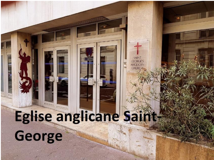
Eglise anglicane Saint-George