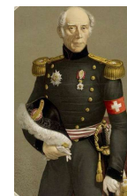
Guillaume-Henri Dufour (1787-1875)