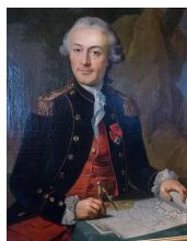
Jean-Claude Le Michaud d'Arçon (1733-1800)