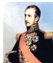
Simon Bernard (1779-1739)