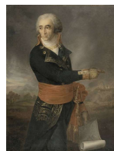
Charles-Louis de Chasseloup-Laubat (1754-1833)