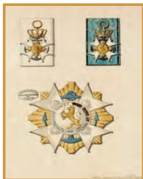
Projet de décoration de l'ordre de la Réunion par Isabey

Enfin, il sera proposé aux donateurs des visites privées des ateliers et dépôts des Archives nationales et des invitations à divers événements organisés par les Archives nationales ou la Fondation Napoléon.