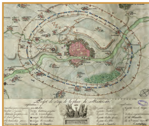
Plan de la ville de Maastricht

Il est possible faire un don en ligne sur notre site www.fondationnapoleon.org , rubrique « Soutenez nos projets ».