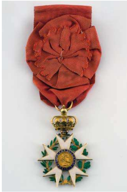
Croix de la Légion d'honneur, Paris, Fondation Napoléon