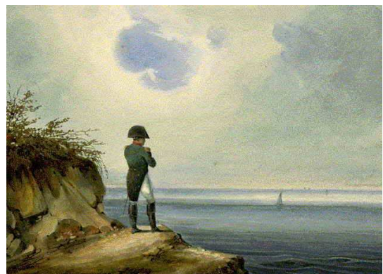
Napoléon à Sainte-Hélène, François-Joseph Sandmann, Rueil-Malmaison, musée national des châteaux de Malmaison et Bois-Préau