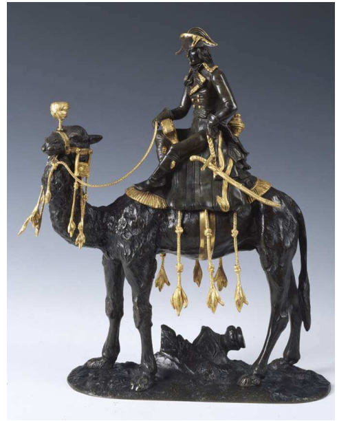
ECOLE FRANÇAISE XIX e siècle Le général Bonaparte sur un dromadaire Sculpture © Patrice Maurin-Berthier