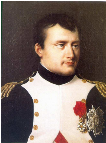
LEFEVRE Robert Jacques François Faust (1755-1830), Portrait en buste de Napoléon 1 er , Paris, Fondation Napoléon