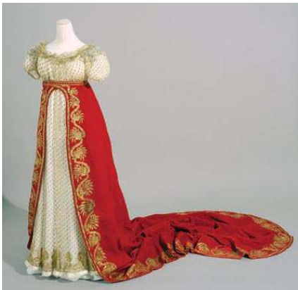
Traîne de cour de Mme Béranger portée le jour du sacre Paris, Fondation Napoléon