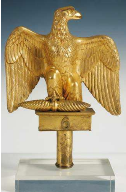
Aigle de drapeau du 6 e régiment des Chasseurs à cheval, Militaria, Paris, Fondation Napoléon